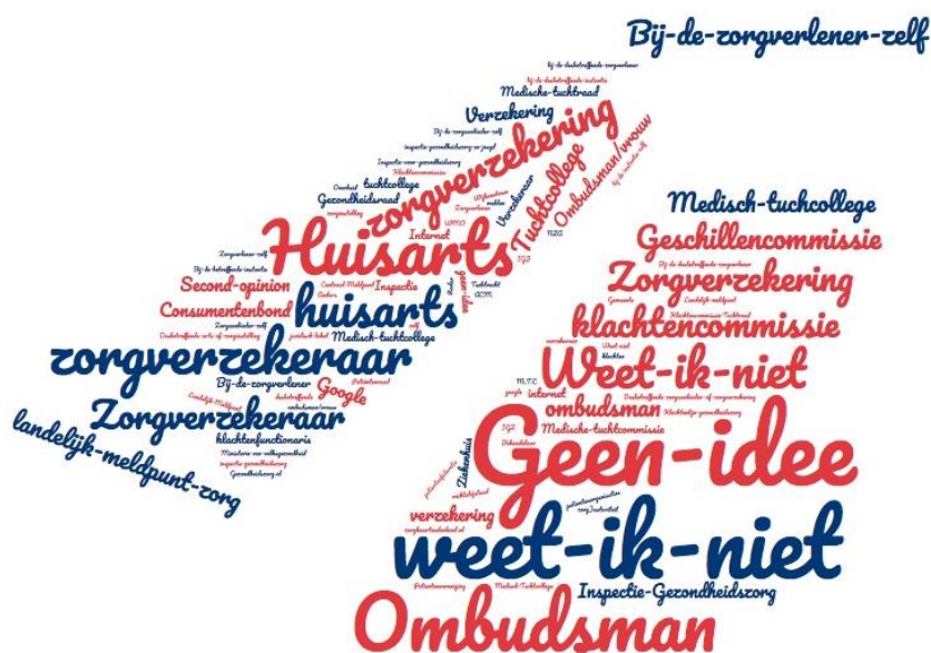
Figuur 3 Waar zou u terecht kunnen met een klacht over de gezondheidszorg?

Alle respondenten werden allereerst open bevraagd naar hun ideeën over bij wie zij terecht zouden kunnen met een klacht over de gezondheidszorg. Deze antwoorden staan weergegeven in figuur 3. Vervolgens werd deze vraag nogmaals gesteld, maar dan met verschillende antwoordcategorieën (tabel 28). Hoewel het antwoord ‘bij de zorgverlener zelf’ in beide gevallen veelvuldig voorkomt, is het bij de open bevraging (figuur 1) opvallend dat een groot deel van de respondenten aangeeft het niet te weten (antwoordcategorieën “geen idee” en “weet ik niet”).