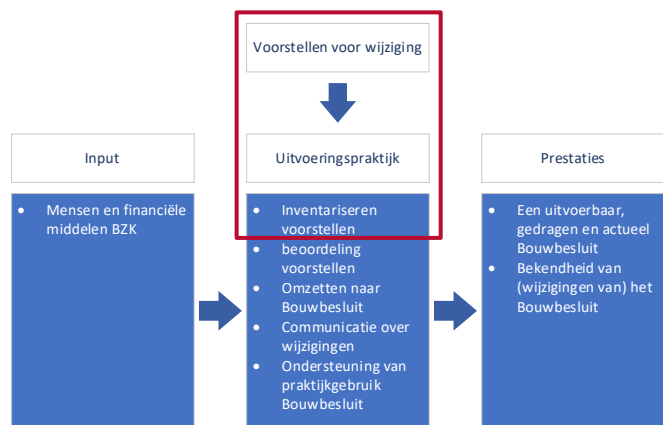
Figuur 3. Het hier beschreven onderdeel van de beleidstheorie

Het precieze minimum kwaliteitsniveau van bouwwerken ontwikkelt zich in de loop der tijd door bijvoorbeeld de introductie van nieuwe materialen en bouwtechnieken, andere (beleids)wensen of nieuwe inzichten. De laatste jaren springen vooral energiezuinigheid en milieu in het oog, maar op alle inhoudelijke onderwerpen zijn er ontwikkelingen geweest. Deze dynamische aard van het minimum kwaliteitsniveau maakt dat het ministerie van BZK permanent bezig is om de regels in het Bouwbesluit te optimaliseren. In de onderstaande tabel staan de dertien belangrijke wijzigingen van het Bouwbesluit die in werking traden tussen 1 januari 2015 en 1 januari 2021.