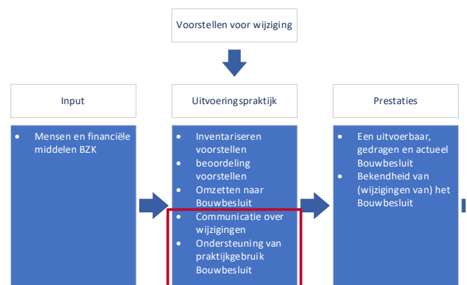
Figuur 6. Het hier beschreven onderdeel van de beleidstheorie

Wanneer het Bouwbesluit gewijzigd is maakt het ministerie van BZK de wijziging bekend. Dit gebeurt via de officiële weg van het Staatsblad. Bij grotere wijzigingen geeft het ministerie van BZK daarnaast ook een opdracht aan bijvoorbeeld RVO of een communicatie-adviesbureau om bijvoorbeeld een filmpje te maken of andere communicatiemiddelen te ontwikkelen. Een voorbeeld hiervan is de invoering van de BENG eisen 30 . Bij vragen over een wijziging, of over het gehele Bouwbesluit, zijn er diverse organisaties die hierbij hulp kunnen bieden aan de vraagsteller. Deze organisaties worden financieel ondersteund door het ministerie van BZK, het gaat bijvoorbeeld om Rijksdienst voor Ondernemend Nederland (RVO) en de helpdesk bouwregelgeving en brandveiligheid.