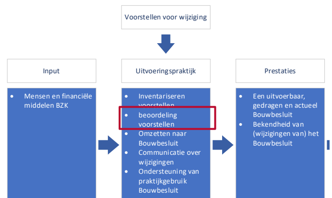
Figuur 4. Het hier beschreven onderdeel van de beleidstheorie

Na de inventarisatie van de voorstellen, doet het ministerie van BZK een eerste beoordeling. Hierbij wordt geanalyseerd in welke mate het achterliggende probleem, interventie van het ministerie van BZK vraagt door middel van beleid of regelgeving en of vervolgens het bouwbeleid of de bouwregelgeving het meest geëigende instrument is, of dat er andere instrumenten zijn die beter passen. 22 Dat kan andere wet- en regelgeving zijn, afspraken met belangenpartijen, of bijvoorbeeld een communicatiecampagne.