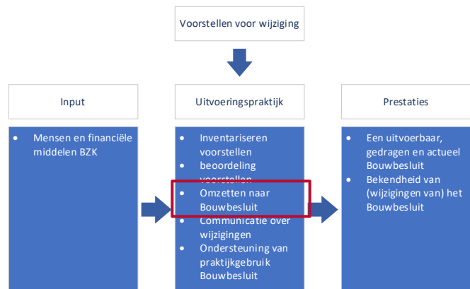
Figuur 5. Het hier beschreven onderdeel van de beleidstheorie

Waterschappen. Eventueel worden er nog interne en externe toetsen gedaan en adviezen ingewonnen, bijvoorbeeld bij de adviescommissie toetsing regeldruk. Vervolgens volgt een formele interdepartementale afstemming en de Ministerraad, de voorhangprocedure bij de Eerste en Tweede Kamer en advies van de Raad van State. Uiteindelijk vindt er een notificatie van de regelgeving bij de Europese Commissie plaats.