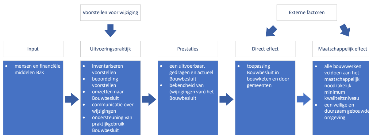
Figuur 1. De beleidstheorie voor begrotingsartikel 4.2

Het beleid dat het ministerie van BZK op begrotingsartikel 4.2 voert, is gebaseerd op een beleidstheorie, welke voor dit onderzoek is gereconstrueerd aan de hand van interviews met BZK. 3 Deze beleidstheorie is – in woorden van de Regeling periodiek evaluatieonderzoek (RPE) – de gehanteerde motivering voor het beleid en bevat de met het beleid beoogde doelen. De beleidstheorie speelt een centrale rol in deze evaluatie. Aan de hand van de beleidstheorie zijn verschillende onderdelen van het proces te onderscheiden, welke ieder beoordeeld kunnen worden op doelmatigheid en doeltreffendheid. In deze paragraaf schetsen we de beleidstheorie op hoofdlijnen. In de hoofdstukken 2 tot en met 5 verdiepen we de verschillende onderdelen van de beleidstheorie en komen we op basis van syntheseonderzoek en aanvullende interviews tot bevindingen over de mate waarin deze theorie ook zichtbaar is in de praktijk. In hoofdstuk 6 beoordelen we, op basis van de beschikbare gegevens, in hoeverre de in de beleidstheorie geschetste processen, resultaten en effecten zich ook daadwerkelijk voordoen.