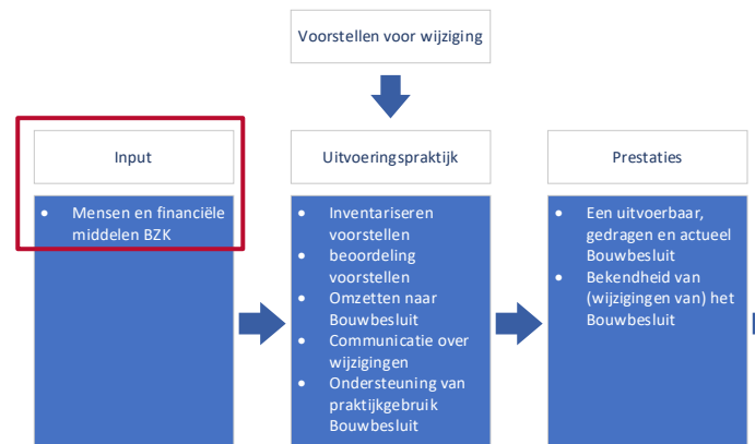
Figuur 2. Het hier beschreven onderdeel van de beleidstheorie

Het bedrag op het artikel is het beleidsgeld en betreft niet de apparaatsuitgaven. Deze uitgaven staan op een separaat en centraal artikel (begrotingsartikel 11).