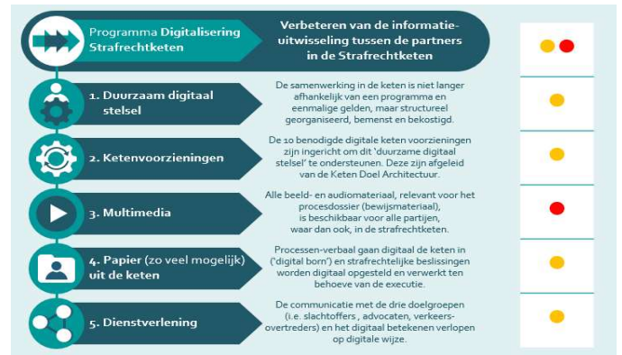
Stand van zaken van de vijf digitaliseringsdoelen

Samengevat zijn voor het digitaliseringstraject drie maatschappelijke doelstellingen voor het jaar 2021 vastgesteld. Het realiseren van deze doelstellingen zijn ondergebracht bij het programma PDSK met een looptijd tot en met 2022. De doelstelling op het gebied van dienstverlening aan de burger is tijdig bereikt. De andere doelstellingen zullen, zoals uit het voorgaande blijkt, in 2023 verder worden gerealiseerd. De 'overall' status van het digitaliseringstraject wordt daarmee gekwalificeerd als "oranje/rood".