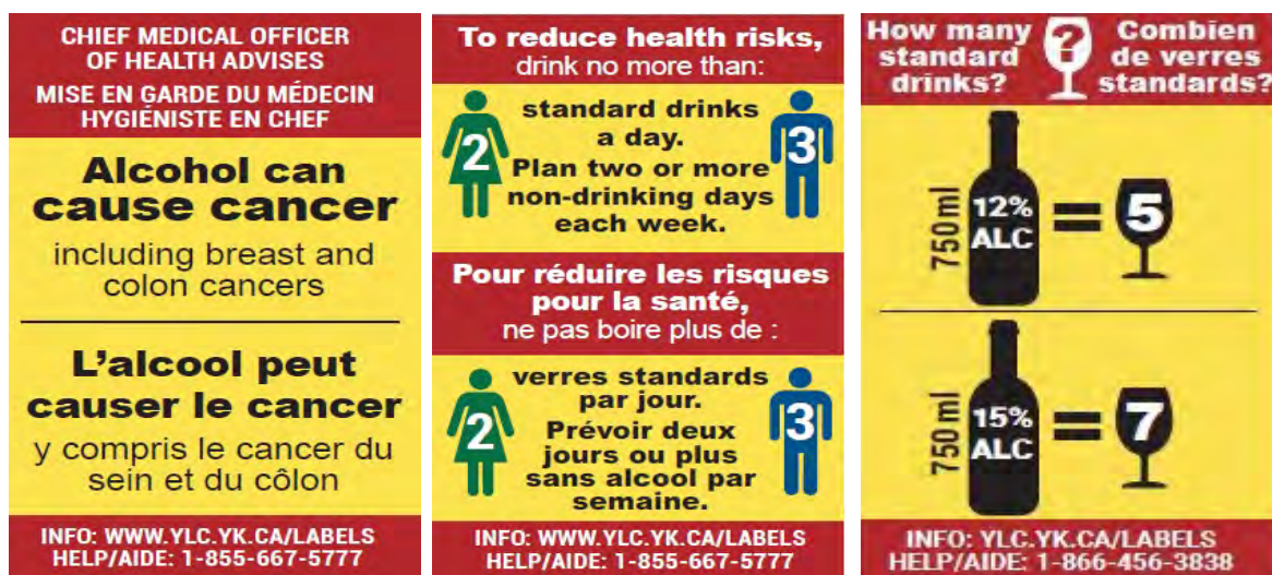
Figuur 5. Van links naar rechts productinformatie en gezondheidsinformatie en -waarschuwingen op etiketten van alcoholhoudende dranken in Canada over: 1) alcohol en kanker; 2) het Canadees drinkadvies: drink maximaal twee (vrouwen) of drie (mannen) glazen alcohol per dag en drink twee of meer dagen per week geen alcohol 3 ; 3) het aantal standaardglazen per verpakking.

Onderzoek naar de effecten van alcohol etikettering is voornamelijk uitgevoerd onder de algemene bevolking. Onderzoek onder specifieke (risico)groepen is beperkt.