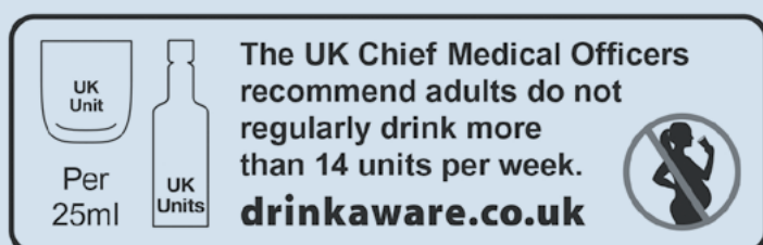
Figuur 4. Van links naar rechts een voorbeeld van productinformatie en gezondheidsinformatie en -waarschuwingen op etiketten van alcoholhoudende dranken in het Verenigd Koninkrijk over: het aantal standaardglazen per verpakking; het Britse drinkadvies; alcoholgebruik tijdens de zwangerschap.

De richtlijnen worden door de alcoholsector deels opgevolgd in het VK. Een studie vond dat op 78% van de alcoholhoudende dranken alle drie de onderdelen van etikettering vermeld stonden, maar dat in slechts 57% van de gevallen de daarvoor opgestelde richtlijnen werden opgevolgd. Zo werden gezondheidsinformatie en -waarschuwingen in tekst bijvoorbeeld kleiner getoond dan de richtlijnen voorschrijven en verscheen het zwangerschapspictogram kleiner op de verpakkingen van wijn dan op bier (Royal Society for Public Health, 2018).