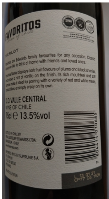
Figuur 2. Voorbeeld van een gezondheidswaarschuwing weergegeven in een pictogram op een etiket van een wijnfles (links) en bierfles (rechts): drink niet tijdens de zwangerschap.