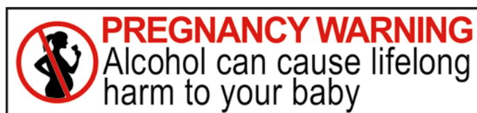
Figuur 3. Voorbeeld van een gezondheidswaarschuwing weergegeven in een pictogram en tekst in Australië en Nieuw-Zeeland over alcoholgebruik tijdens de zwangerschap.