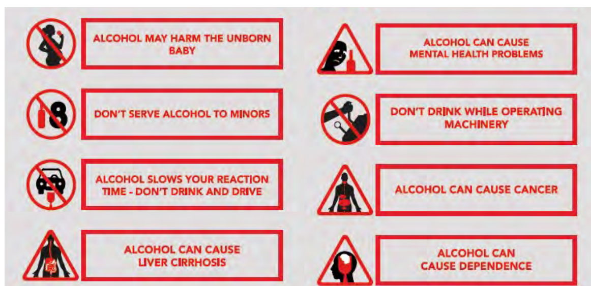
Figuur 6. Voorbeelden van verschillende thema's van gezondheidsinformatie en -waarschuwingen op etiketten van alcoholhoudende dranken weergegeven in pictogrammen en teksten (WHO, 2017).