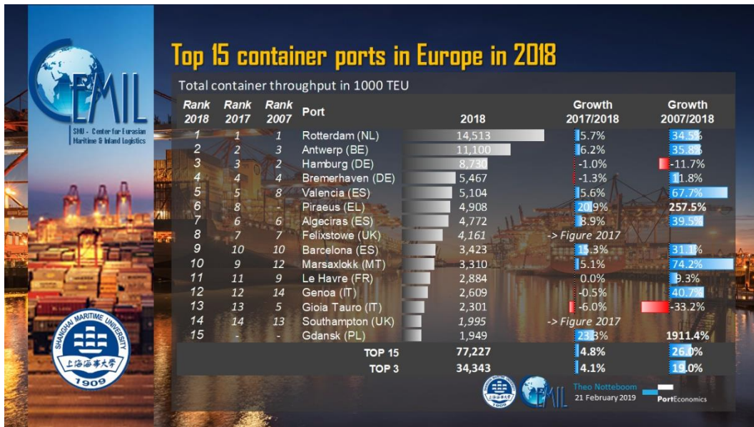
Figuur 3.1 Top 15 containerhavens en de groei/krimp tussen 2007 en 2018 (Notteboom, 2019)

De andere Nederlandse zeehavens van nationaal belang hebben in de containersector vooral de rol van haven voor feeder-diensten. Wel kan dit, zoals in bijvoorbeeld Moerdijk, een sterk groeiend segment zijn. Moerdijk is in toenemende mate een intermodale hub voor containerverkeer tussen het Verenigd Koninkrijk en continentaal Europa.