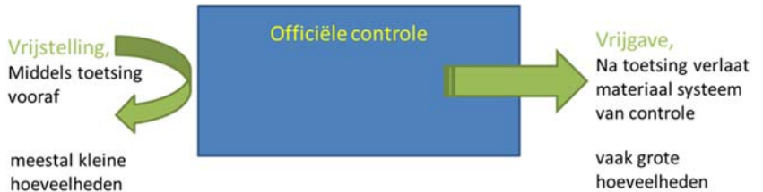
Figuur 3. Schematische weergave van vrijstelling en vrijgave van het controlestelsel

Een belangrijk begrip bij de begrenzing van het controlestelsel is de «niet-verwaarloosbare blootstelling». Dit begrip wordt op diverse plaatsen in de richtlijn toegepast en is daarin uitgewerkt in Bijlage VII, onderdeel 3. De inhoud van deze bijlage is als bijlage 3 bij het besluit opgenomen.